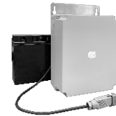
Akkupaket extern 1x 12 V / 18 Ah (22 Ah)