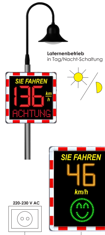
Laternenbetrieb in Tag/Nacht-Schaltung