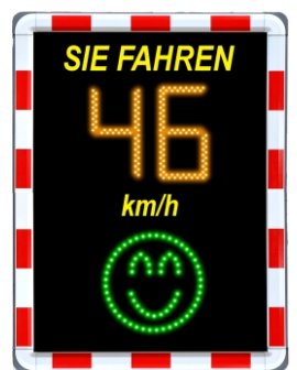
Vorbereitet auf Stecker für einen festen Stromanschluss