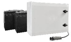
Doppelakku extern 2x 12 V / 18 Ah (22 Ah)