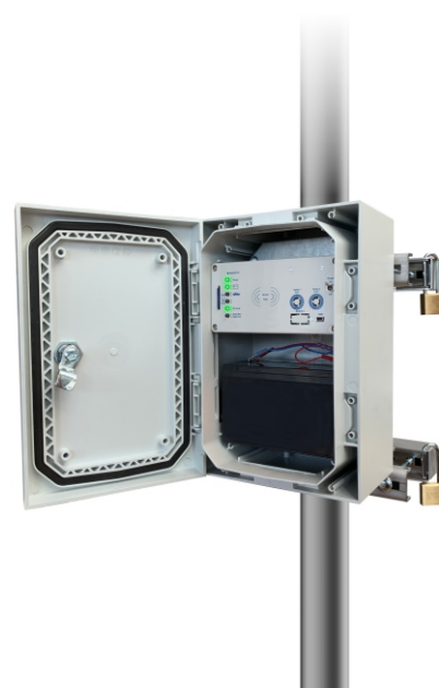
geöffneter Traffic Counter: LED-Kontrolleinheit, Akku, abschließbare Gehäusetür mit Komplettabdichtung. Standardmäßig befestigt mit unserer abschließbaren Schnelleinhängvorrichtung "MaFlex"