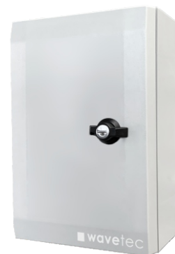
wavetec Traffic Counter: kompakt und leicht im Transport, exakt und präzise in der Messung