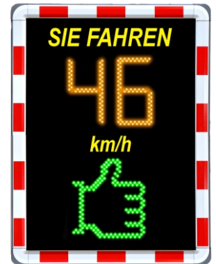
wavetec Grand Up 70 cm x 90 cm