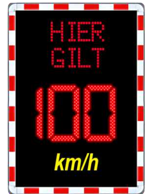
wavetec Giant Reminder 90 cm x 125 cm