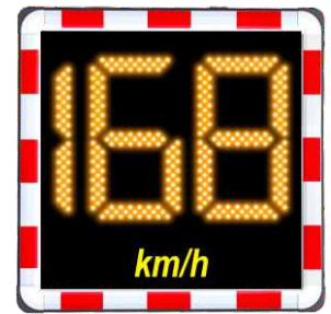
wavetec Cube Reflector 70 cm x 70 cm